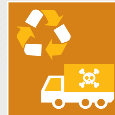
Schadstoffmobil oder Recyclinghof